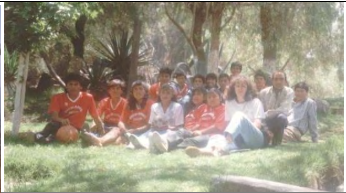
Pues sí, después de cuatro años, íbamos a tener la primera promoción de Medio en la Unidad Educativa. La propuesta fue llevarlos de viaje de estudios, fuimos a Cochabamba.