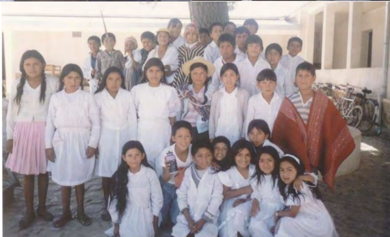
Y despedida del curso. Día de fiesta y teatro.