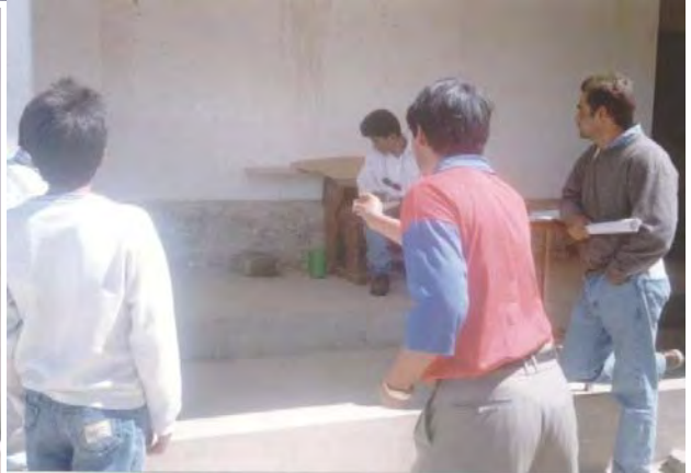
1996. San José de Calasanz. Los profesores preparan juegos con cada curso, hacen una especie de feria. Disfraces, baile, refresquito, teatro.