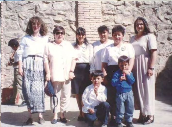
En agosto volvimos a Celebrar las Fiestas Patrias.