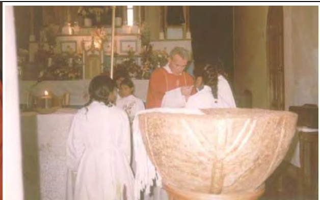
Visitamos el Cristo de la Concordia, Teatro Achá, La Casona, Entel, la Alcaldía, el Jardín Botánico, Biblioteca Nacional. Agosto, momento de confirmaciones.