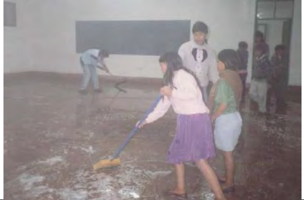
En el internado comenzamos a limpiar y dejarlo, "bien bonito" para que pueda continuar su actividad durante el verano, como lugar de cursillos, y de acogida.