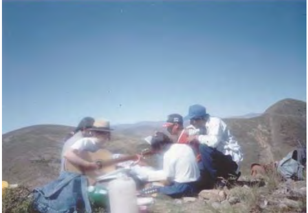
Día de excursión con los internos que se quedan el fin de semana. Hay muchos que han venido de la zona de T'oro-T'oro. Hay que crear lazos, conocer su historia, acercarnos y, sobre todo, aprender.