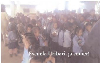
Escuela Uribari, ¡a comer!

por la ayuda que presto al país. Pero nada más."