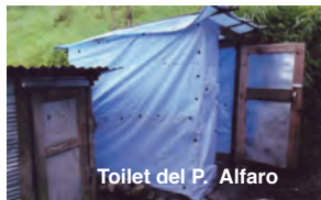
Toilet del P. Alfaro

muy húmedo. De “modo y manera” que, si no tropiezo y vuelvo a un precipicio, ponle la firma que me moriré de frío, bronquitis o tuberculosis.