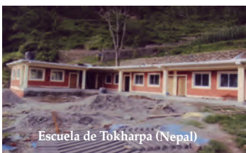
Escuela de Tokharpa (Nepal)

Desde agosto pasado 2019, el P. Alfaro me cuenta algunas cosas, además de las que escribe en sus Cartas, dignas de mención. Por ejemplo: hace ya más de un año que está escribiendo, a mano, como sus Cartas mensuales, comentarios sobre diversos libros de la Biblia, con el título general de: "La Gran Promesa. La Santa Biblia alrededor del fuego". Lleva ya escritos 21 capítulos, con un total de 643 páginas, por ahora. Le queda trabajo para algo más de un año. Cuando acabe el Antiguo Testamento, pasará al Nuevo Testamento. Yo guardo los originales y los escaneo, y poco a poco voy escribiéndolos en Word en el ordenador, como hice con los libros anteriores que escribió sobre S. José de Calasanz, Sta. Teresa de Jesús, y S. Faustino Míguez. Los dos primeros ya fueron publicados de forma impresa. Son comentarios serios de los libros del Antiguo Testamento, (Job, Samuel, Reyes, Isaías, Jeremías, Ezequiel, etc), pero dichos con su humor característico de picadillo, de quien lo está explicando en ese ambiente especial "alrededor del fuego". Los dibujos que acompañarán, serán tomados de las pinturas catequéticas de estilo nepalí que hay en las paredes de la catedral de Kathmandú, capital de Nepal, la "Assumption Church", sede del único Obispo de Nepal, y que es la única Parroquia Católica autorizada por el Gobierno Comunista. El 15 de agosto pasado celebraron allí los 25 años de dicha Parroquia, en cuya celebración estuvo también el P. Alfaro. Por cierto,